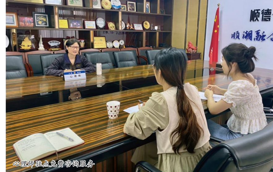
心理师驻点免费咨询服务