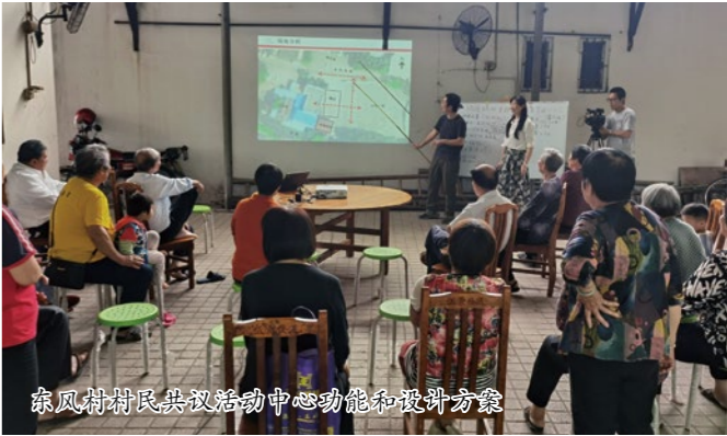
东风村村民共议活动中心功能和设计方案

“和美社区计划”以顺德 205 个村居的社区问题和居民需求为出发点，重点资助教育发展、社区照顾、社区营造、公益创新四个领域的公益慈善项目，发挥慈善资金的撬动作用，联动社区多元主体和资源共同参与，积极搭建顺德本土公益资源与专业支持平台，努力提升社区居民生活质量，共建和美社区、幸福家园。