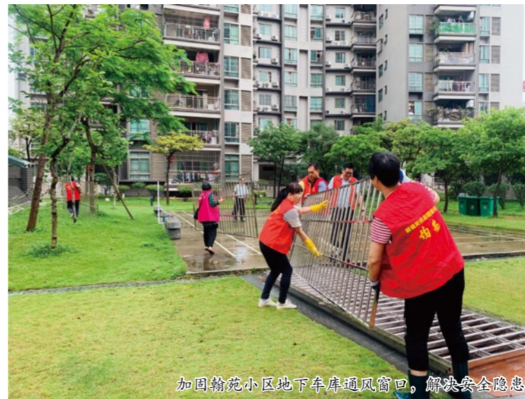
加固翰苑小区地下车库通风窗口，解决安全隐患

革试点项目之一，由于历史遗留问题，出现党建阵地建设薄弱、小区业主委员会与物管之间矛盾分歧、居民参与能动性低等治理难题，直接影响到社区的和谐。项目通过“共享基金计划”以及民主议事，有效带动了“翰苑”农民公寓业主共同解决地下停车场通风口安全隐患、基础设施薄弱等问题。