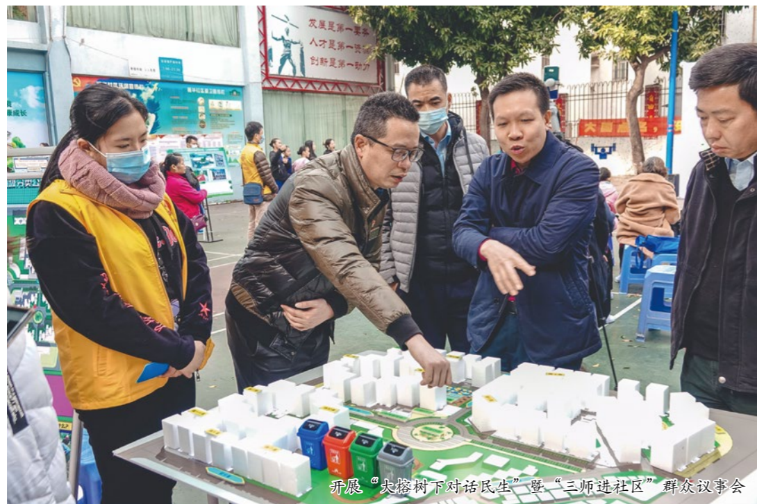
开展“大树树下对话民生”暨“三师进社区”群众议事会

以“双过半”的表决通过了交通优化方案，开展设置车牌识别道闸、制定车辆停放管理制度及公开招标第三方单位管理等工作，同时发动小区热心党员群众成立“康富花园爱我家志愿服务队”值岗疏导交通，康富花园交通拥堵、乱停车、消防安全通道堵塞问题得到有效解决。