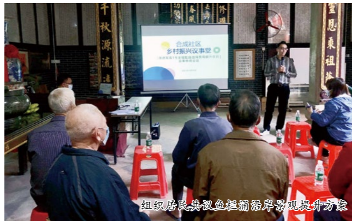
组织居民共议鱼栏涌沿岸景观提升方案

合成社区鱼栏涌沿岸景观提升项目位于鱼栏涌（观音路1号至榕胜路段）旁，项目沿涌段长约150米，覆盖面积约1500平方米，项目涵盖了景观长廊、儿童乐园、亲水平台、党群议事厅等配套设施，打造成为居民乐于驻足、亲近自然、融休闲娱乐于一体的户外亲水公园。