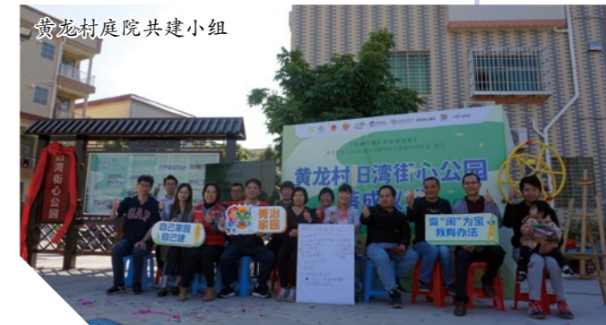
黄龙村庭院共建小组

黄龙村庭院议事共建行动项目，以村民为“主角”，组成“共建小组”，通过议事协商和“种子计划”微创投激发村民参与社区事务建设。小组成员从商议到行动都全程参与其中，如讨论场地清理问题、空间布局，动手做布局模型等；而“种子计划”微创投，更是出乎意料地收集到8个改造行动，他们以自己的一技之长、兴趣爱好等，真正做到“落手落脚”去改造自己的家园。在庭院共建过程中，还意外地收获到一批年轻力量，除了亲自参与到行动中，更是带来了其他优质的资源支持庭院改造。正如一位小组成员感慨的分享：“大家齐心协力把荒地变成公园，日常