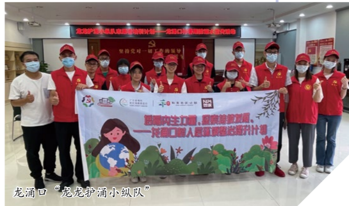
龙涌口“龙龙护涌小纵队”