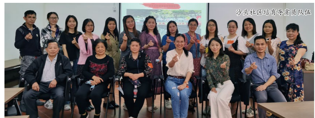
沙头社区培育导赏员队伍