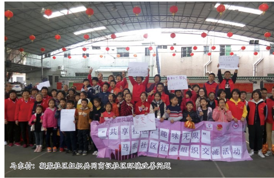
马东村：凝聚社区组织共同商议社区环境改善问题

带领着社区组织确认目标、完善组织架构、服务模式 and 规则等。另一方面社工也要做好资源联动者的角色，加强社区和社区组织间的良好互动，社区给予社区组织鼓励和肯定，对其付出作出积极反馈，从而促进社区组织更积极地投入社区服务中，形成良性循环。