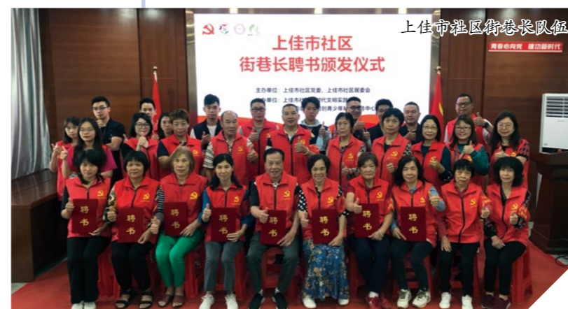
上佳市社区街巷长队伍