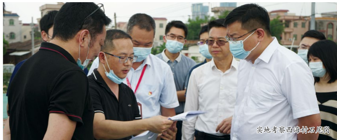
实地考察西海村石尾岗