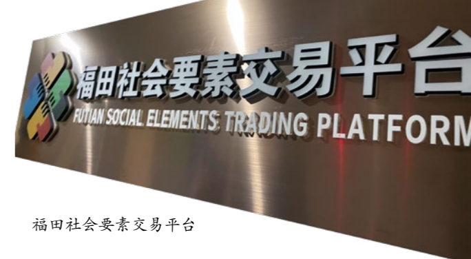
福田社会要素交易平台

龙华区大和村是典型的城中村，非户籍常住人口是原居民的 10 倍以上，基础设施薄弱、公共资源短缺，居民对社区治理、公共服务有较高的期盼和诉求，社区治理难度大。龙华区于 2018 年在大和村创建全国首个“社工村”，以街道社工服务站为平台，招募 30 名不同专业特长社工成立社工之家；2020 年以大和村城中村综合整治为契机，坚持党建引领，引入群众议事协商“参与式”优化设计城中村空间，推动社区多支力量齐