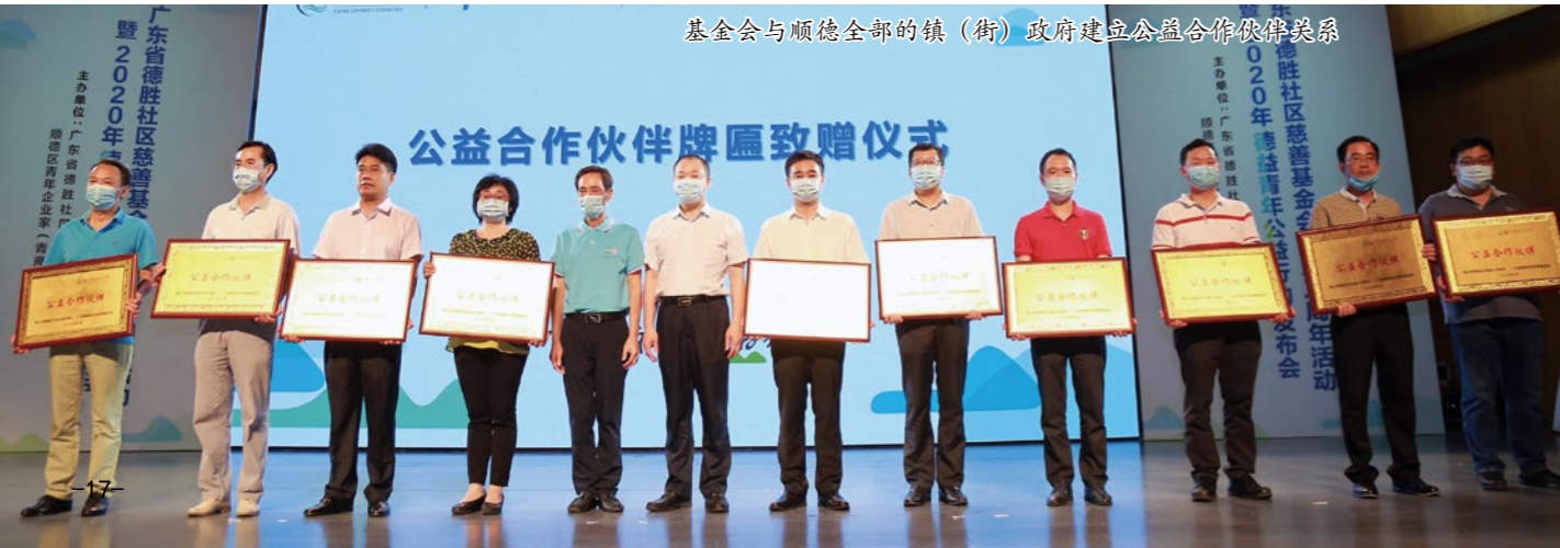
基金会与顺德全部的镇（街）政府建立公益合作伙伴关系

三是进行政策倡导。如助力伦教、龙江出台项目配资办法，每年安排 400 万财政预算配套支持公益项目，形成更大的合力。