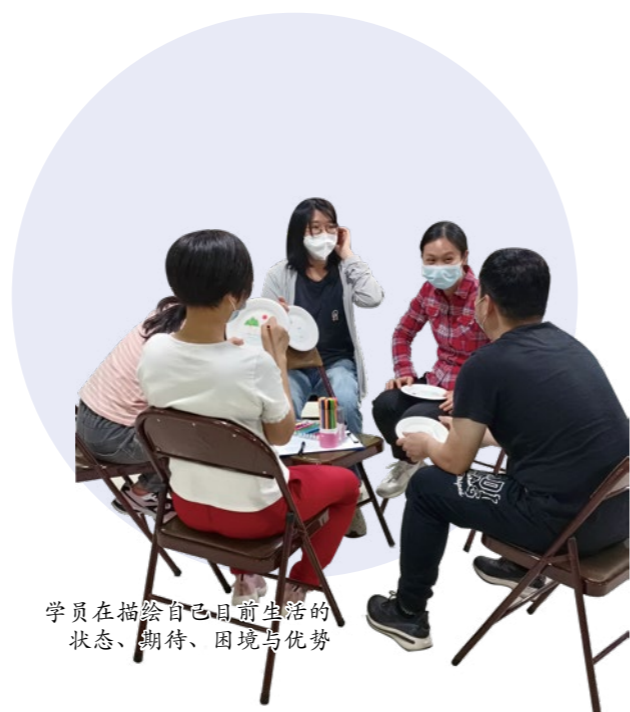
学员在描绘自己目前生活的状态、期待、困境与优势