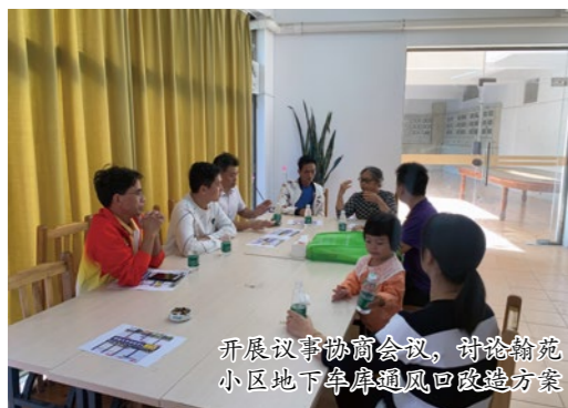
开展议事协商会议，讨论翰苑小区地下室通风口改造方案

2.0美化改造行动的意见。相比此前意见单一，本次活动方案收到了各种各样的意见，引发了一众参加者的热烈讨论。议事团队在与小区居民的进一步沟通发现，他们对于小区健身设施和石凳的增设有更大的需求，在各方代表的持续沟通及参与中最终落实了翰苑小区2.0美化改造方案。期间鹤峰社区党委、翰苑小区党支部、居民议事