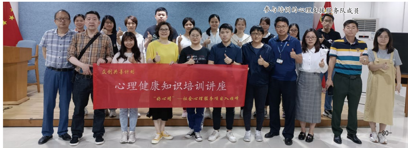
参与培训的心理支援服务队成员