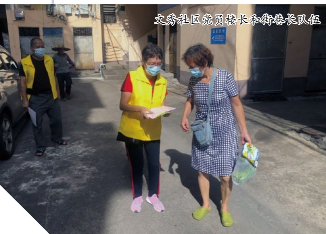
文秀社区党员楼长和街巷长队伍