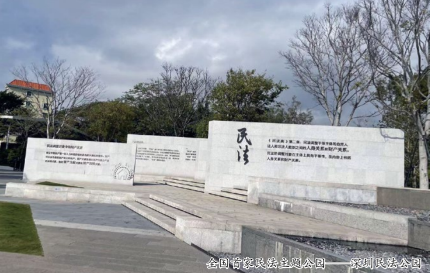
全国首家民法主题公园——深圳民法公园