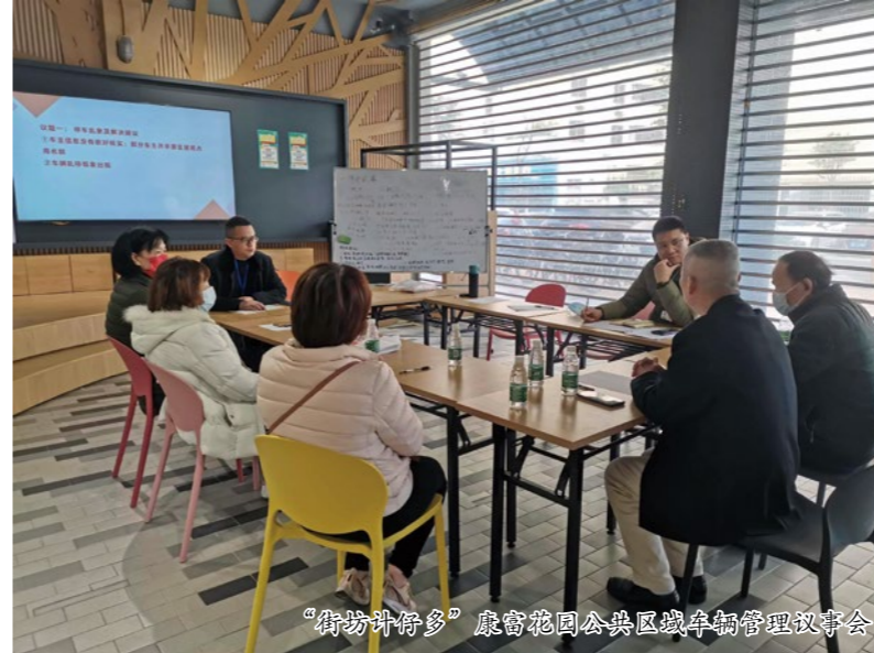
“街坊计仔多”康富花园公共区域车辆管理议事会

区基础设施残旧老化、管线乱拉乱接、交通拥堵车辆乱停放、雨污管道合流、燃气管道及公共配套设施不全、人居环境较差等问题日渐突出，无法满足居民群众日益增长的生活需要，迫切需要