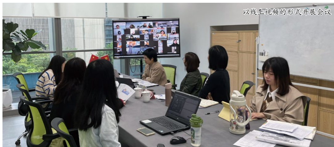
以线上视频的形式开展会议