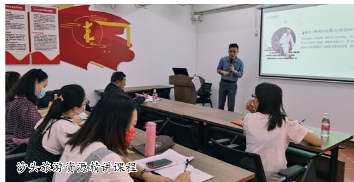
沙头旅游资源精讲课程

均安镇沙头社区拥有丰富的古建筑资源,全社区共有宗祠、庙宇、书室等古建筑、历史文物建筑十多处,自梳女文化、锣鼓柜巡游、粤曲文化等民间文化更是享誉盛名,是沙头特有的文化名片之一。为此,沙头社区联合专业研学团队,结合社区丰富的文化资源,共同探讨开发社区文