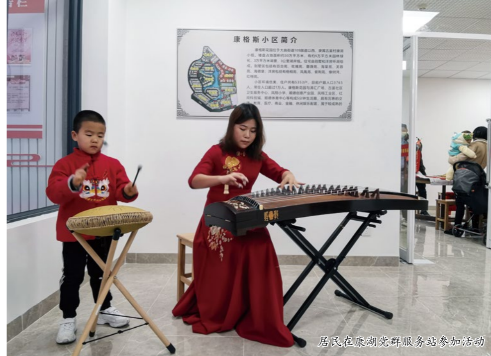
居民在康湖党群服务站参加活动