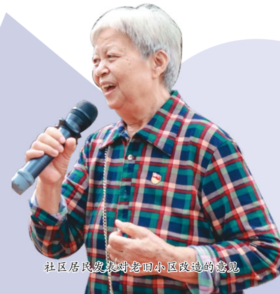
社区居民发表对老旧小区改造的意见

针对康富花园反映最为强烈的乱停车堵塞通道问题，振华社区党委组织党员群众通过入户走访、线上联系、电话访谈等方式访问了康富花园2000多住户。结合康富花园实际情况，综合上级政府部门意见及康富花园居民建议，制定了康富花园交通优化整治方案及制定相关管理制度，并