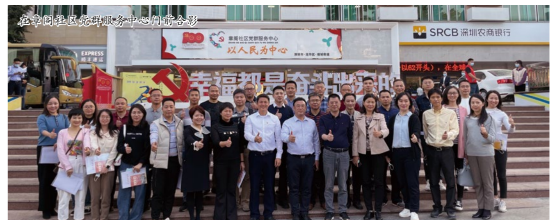
在章阁社区党群服务中心门前合影