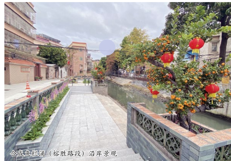
合成鱼栏涌（榕胜路段）沿岸景观