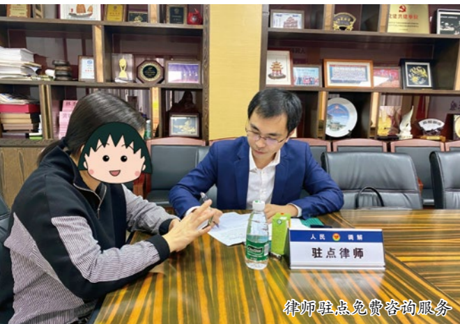
律师驻点免费咨询服务

免费咨询以及法律协助，涉及企业合同纠纷、民间借贷纠纷、侵权纠纷、劳动纠纷、物业纠纷等方面的内容，线上线下为新市民答疑解惑，进一步增强了企业对法律风险的防范意识。