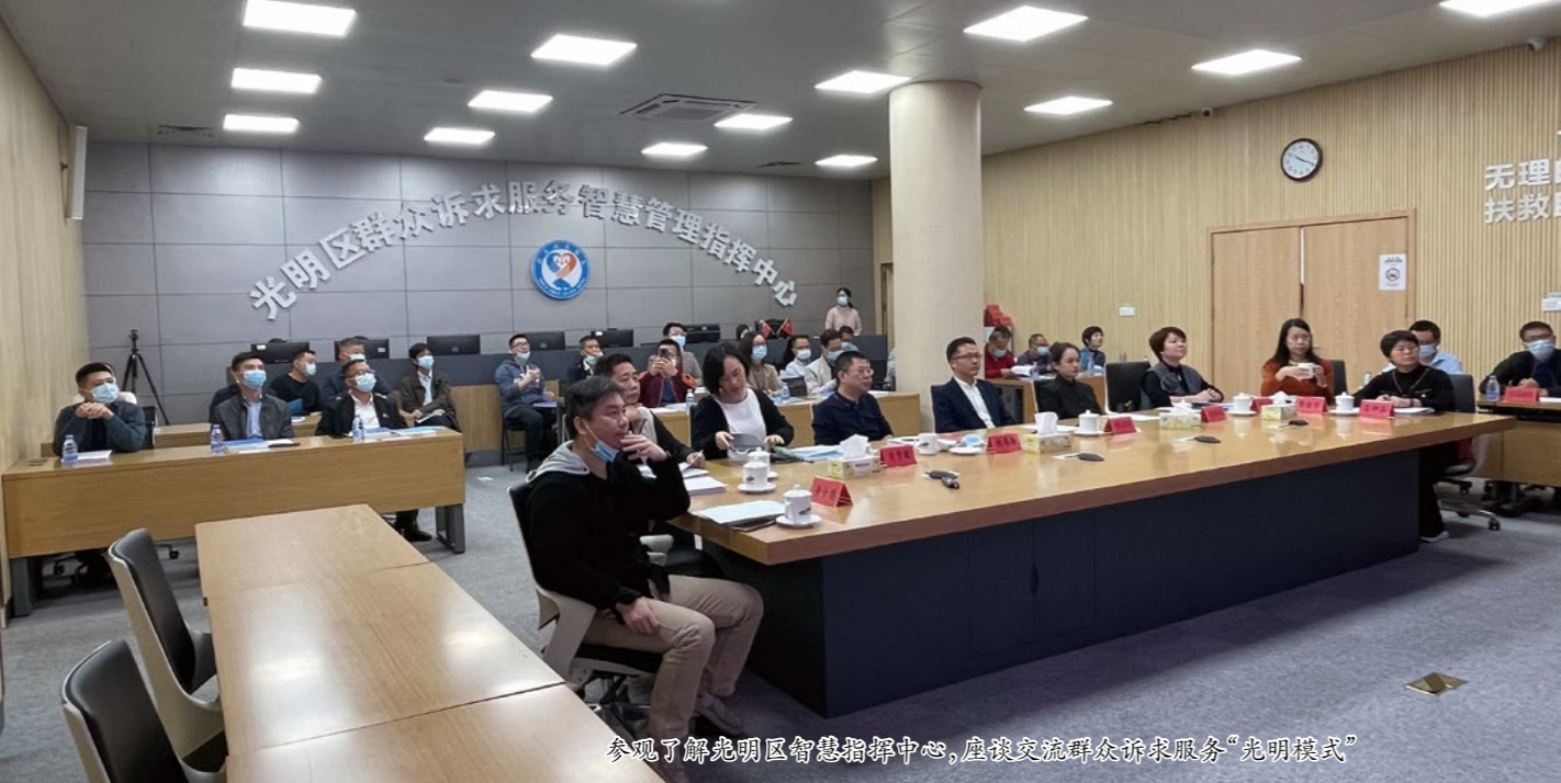
参观了解光明区智慧指挥中心, 座谈交流群众诉求服务“光明模式”

性闭环。光明区 2019 年矛盾化解率达到全市第一，社会治安明显好转，获 2019 年全国信访工作“三无”区，2021 年 9 月中央政法委秘书长陈一新到访调研，高度肯定了群众诉求服务的“光明模式”。