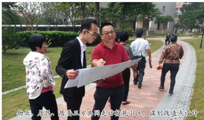
物业、居民、居委三方共同走访翰苑小区，谋划改造点设计