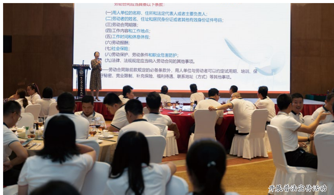
开展普法宣传活动

德和社区潮汕商会党支部坚持党建引领，在面对新时代新形势新要求下，商会积极巧用“乡