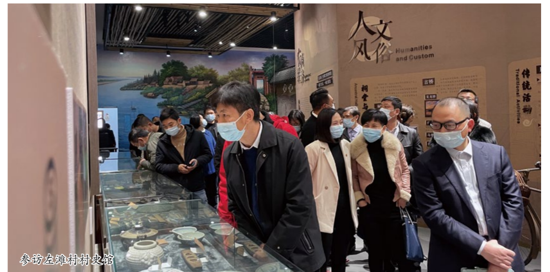
参访左滩村村史馆