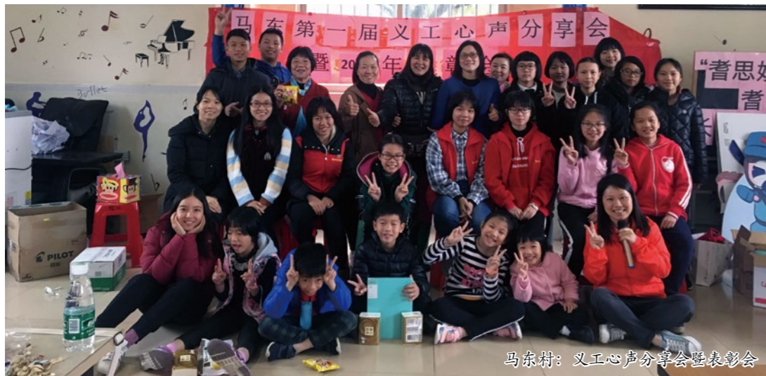
马东村：义工心声分享会暨表彰会