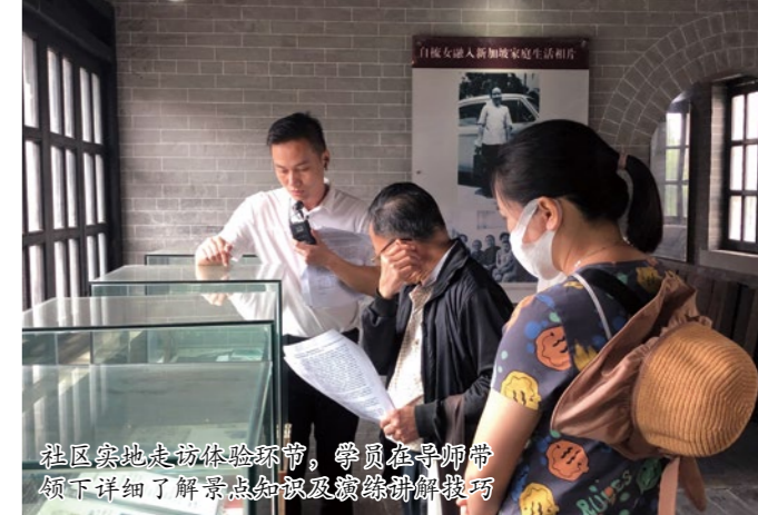
社区实地走访体验环节,学员在导师带领下详细了解景点知识及演练讲解技巧

点,撰写适合自己风格的讲解稿。在强化练习后,通过现场的实战考核交流,学员们积极发挥,最终获得授课导师以及社区居委代表的认可。学员感谢社区提供学习平台交流成长,不仅能获得高质量的讲学课程知识,学习到作为导赏员讲解技能、礼仪技巧知识,还对沙头社区文化资源有了进一步的了解。期望日后能通过社区导赏服务,助力社区文化保育工作。