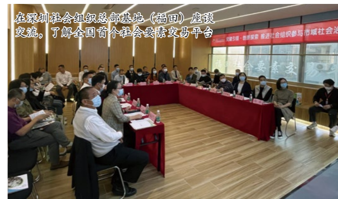
在深圳社会组织总部基地（福田）座谈交流，了解全国首个社会要素交易平台

法委牵头下，基地积极用好“互联网+”手段，成立全国首个社会要素交易平台，发布政府职能转移和购买服务项目，为政社企媒间的合作提供集约化服务“商城”，促进供需有效对接；设立“福田区社会组织服务周”，宣传推广品牌机构和品牌项目，提升了“福田经验”社会影响力。