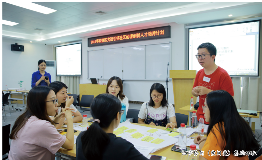
叙事协商（空间类）基础课程