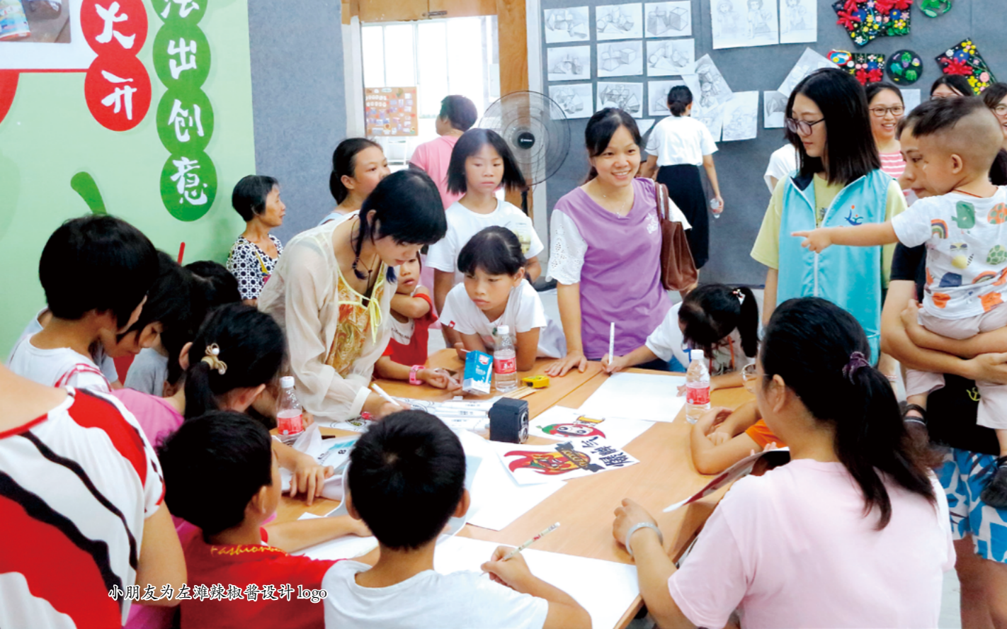
小朋友为左滩辣椒酱设计logo

组整体情况、公共空间、风俗节庆、村民日常生活、生产队及周边环境情况、村民改造建议、调研团队小结分析及生产队改造建议等七大方面内容，为生产队改造方案提供了大量的基础资料和设计保障。