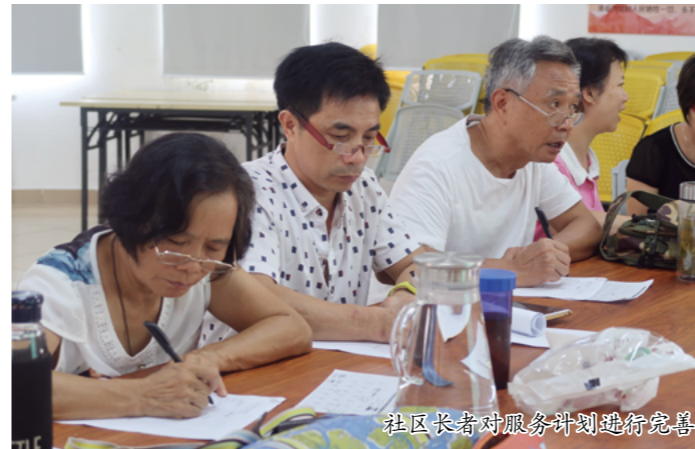
社区长者对服务计划进行完善

为了充分发挥社区有技能、有特长、热爱社区的居民力量，将居民能力转化为社区教育资源，2019年7月，常教社区营造项目开展“爷爷奶奶逆生长营”导师培训计划，从社区中招募了10名50-70岁的技能长者，通过“培训+实践”的形式，将技能长者培养成能够独立开展社区教育课程的长者居民导师。