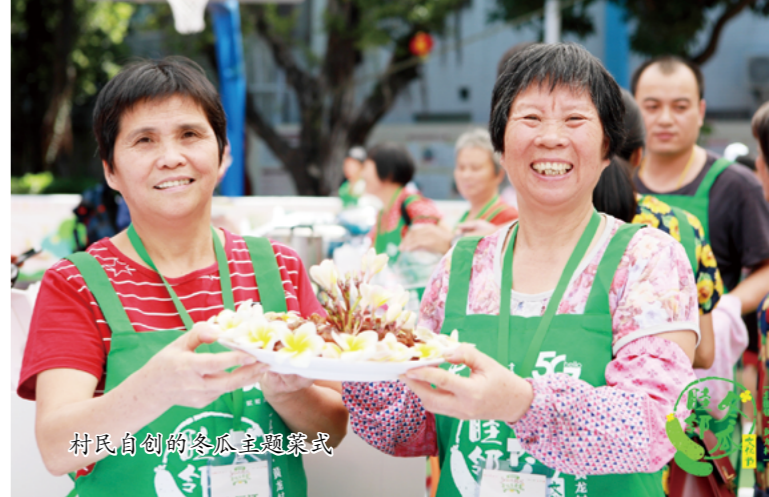
村民自创的冬瓜主题菜式

黄龙村协同村民及多方主体产出黄龙黑皮冬瓜文创产品1批、黄龙村黑皮冬瓜文化主题宣传视频1部、黄龙村黑皮冬瓜主题美食近30道、黑皮冬瓜种植文化主题沙画1个、“丰收喜乐在黄龙”冬瓜主题舞蹈1个、黄龙村黑皮冬瓜种植地图1份，挖掘冬瓜种植达人超过35名，并将于后续产出黄龙村《瓜农故事集》、黄龙村冬瓜文化主题绘本等可视化成品。同时，黄龙村将动态收集并向合作社反馈村民对于黑皮冬瓜活动的期待与设想，为形成可持续可视化的冬瓜文化打好更坚实的群众基础。