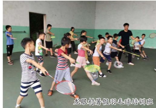
龙眼村暑假羽毛球培训班

龙眼村妇女儿童之家、龙眼村小学，邀请专业师资队伍共同开展一系列暑假培训班活动。该活动获得区3861公益创投大赛资助，共分为10个项目类型，设置13个班，分别是：书法班（基础班、提升班）、国画班（基础班、提升班）、象棋（中国象棋、国际象棋）、阅读班、乒乓球、手工制作班、羽毛球班、龙舟说唱班、红豆班及口才班，吸引了村内300多名儿童及青少年参加。其中，口才班开展了演讲比赛检视学习成果，13名儿童自信地站在龙眼石板桥面，对龙眼文化娓娓道来：有的讲“太尉庙、点睛台与龙眼点睛习俗”；有的讲“龙眼梁氏名人梁敦彦和清华学堂的渊源”；还有的讲“古桥、镇北桥与龙眼八景之一——古桥秋月的典故”，内容丰富，演绎更是精彩，引来了一批街坊驻足围观。