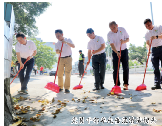
党员干部率先垂范清洁街头