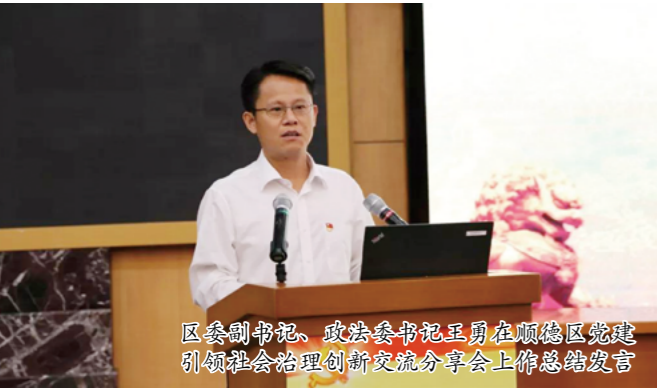
区委副书记、政法委书记王勇在顺德区党建引领社会治理创新交流分享会上作总结发言

稳定和谐的社会环境是关系社会发展和基层治理能力现代化建设的重要基础，作为中国最早探索社会治理创新的地区之一，顺德把握建设高质量发展体制机制改革创新实验区的契机，勇于突破，着力解决制约高质量发展和建设现代经济体系的问题和障碍，开展了系列具有创新性、突破性、引领性的社会治理创新实践和探索。