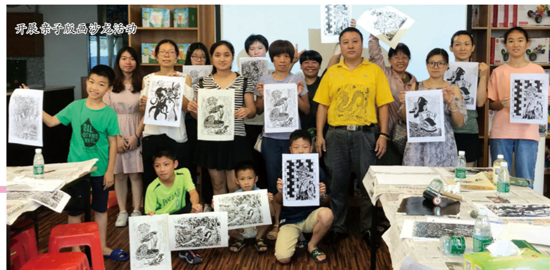
开展亲子版画沙龙活动