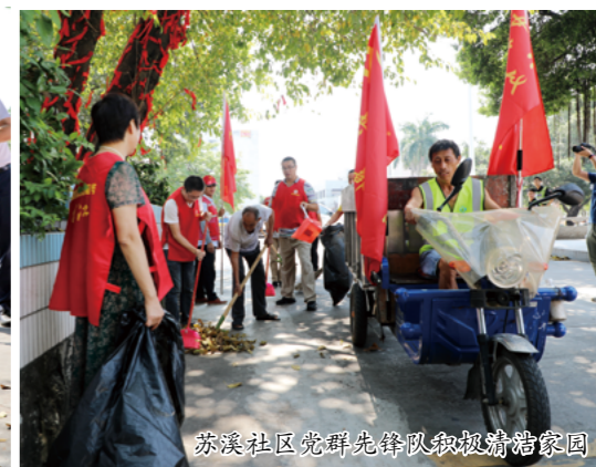
苏溪社区党群先锋队积极清洁家园