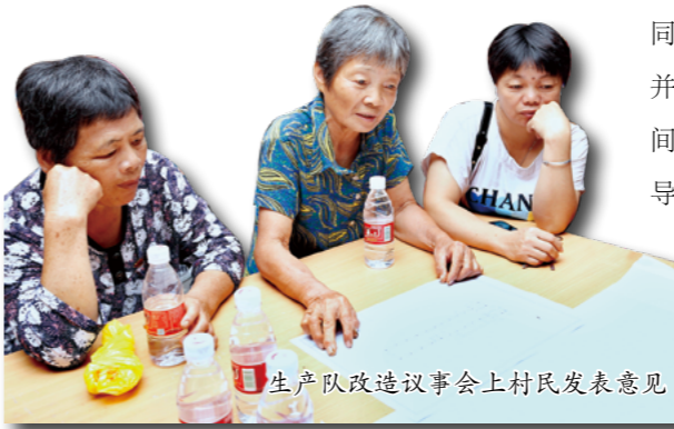
生产队改造议事会上村民发表意见

今年6月，龙江镇左滩村以“参与式规划”为工作手法，联合顺德区社会创新中心、顺德区诚志建筑工程有限公司、乐从镇睿航社会工作服务和研究中心等多方团队（以下简称“参与式规划小组”），以涌口生产队和东约的改造活化为起点，开启社区公共空间的改造活化的探索。在短短的三个月时间里，参与式规划小组通过社区走访、外展宣传、问卷调查、多方议事会、方案公众展示日等多种的方式收集村民的意见，并合众之力设计和完善涌口生产队的改造方案。