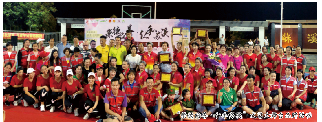
“崇德向善·仁和苏溪”文艺大舞台品牌活动

的关键群体参与到社区事务。参与者与社区居民具有广泛的利益一致性，有普通居民的一员，也有行业精英，活跃在社区治理的各个领域，具有