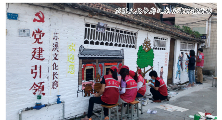
苏溪文化长廊之南坊墙绘微行动

查、座谈征询等形式，参与共议村史馆、苏溪广场、苏溪牌坊等乡村振兴项目，并参与其他社区议题包括社区购买专业社工机构服务的意见、“爱莲书院”社区学院建设意见等。