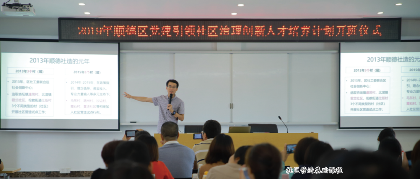
社区营造基础课程