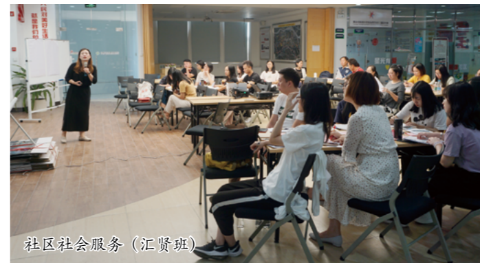
社区社会服务（汇贤班）

为贯彻落实顺德区推动党建引领社区治理创新、深化社区营造工作相关政策和要求，在区委政法委、区民政和人力资源社会保障局的指导下，区社会创新中心结合过往工作积累，围绕党建引领、培育组织、健全机构、活化阵地、丰富活动五大工程内容，整合“社区人才公益培训计划”和“汇贤社会创新人才计划”，开展2019年顺德区党建引领社区治理创新人才培养计划（以下简称“人才培养计划”），建设分层分类分领域的系统并以实践为导向的人才能力培养体系，致力于培养一支专业水平高、协作能力强、综合素质硬的本土社会治理人才队伍，为基层社会治理创新注入人才活力。