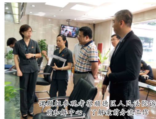
课题组参观考察顺德区人民法院诉前和解中心，了解案前分流工作