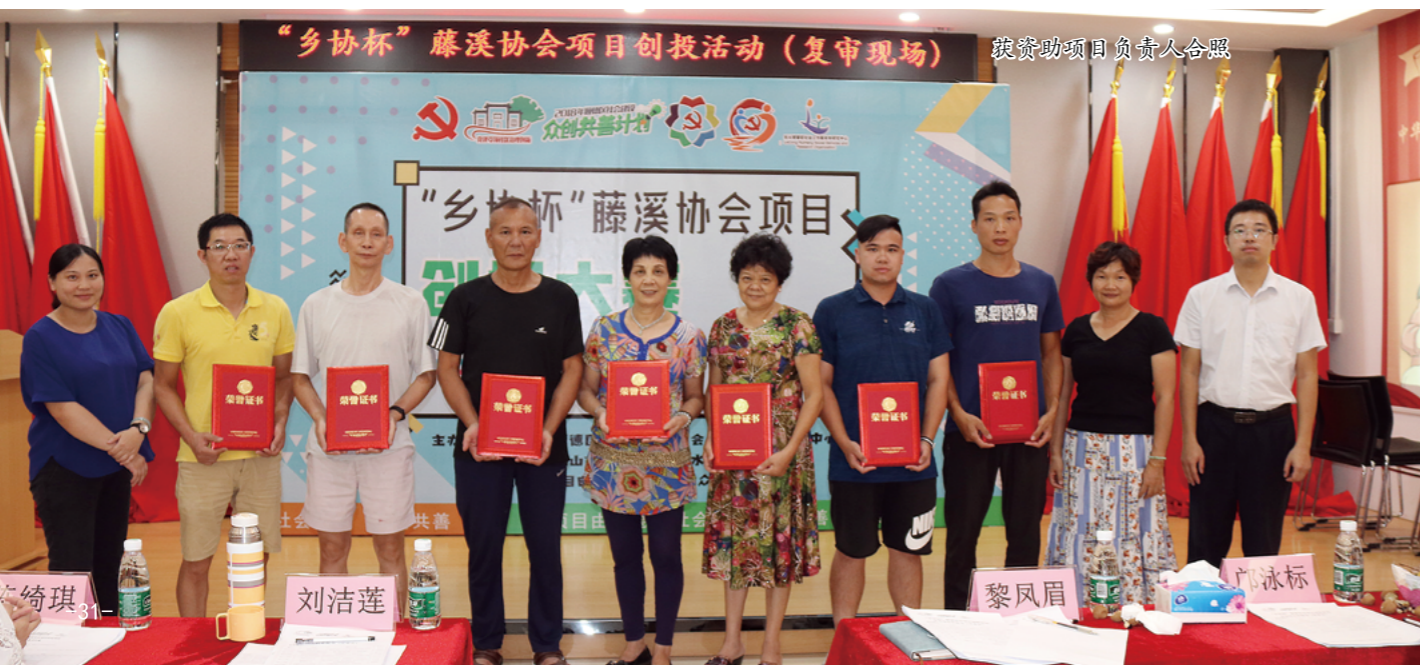
“乡协杯”藤溪协会项目创投活动（复审现场） 获资助项目负责人合照