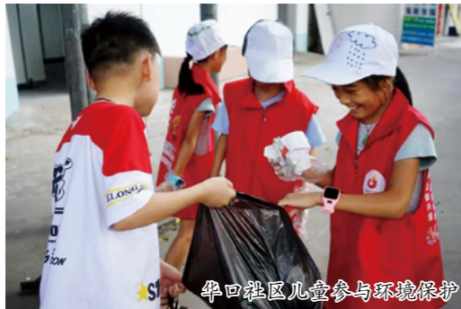
华口社区儿童参与环境保护

为丰富社区儿童及青少年暑假生活，缓解双职工家庭孩子“无人看管”的问题，容桂华口、勒流龙眼、杏坛等多个镇（街道）开展丰富多彩、形式多样的暑期活动，涵盖课业辅导、社区实践、兴趣培育、文化科普等内容，让社区儿童及青少年度过了一个健康、快乐、充实的暑期。