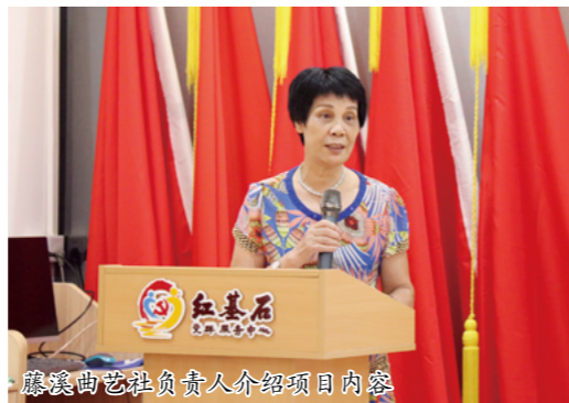
藤溪曲艺社负责人介绍项目内容

活动得到“众创共善”计划及水藤村委会的大力支持，8月14日下午，项目复审会在红基石党群服务中心如期进行。水藤村“两委”代表、睿航社工代表以及水藤村优秀党员共7人组成评审团，为复审项目进行综合评审，并就整体项目方案提出深化建议及整改意见。7个申报计划涉及到社区文化活动、公益慈善、社区治理等范围，包括“红基石杯”乒乓球邀请赛、亲子篮球计划等社区文化服务，丝网花入户探访退休党员、特殊群体关怀以及河涌清理等服务项目。经过评审团的综合评议，7个计划都有固定的服务团队、自