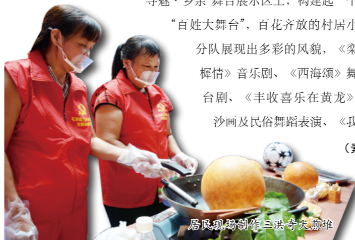
居民现场制作三洪奇大煎堆