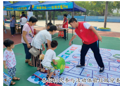
杏坛村民参与活动体验垃圾分类

7月16日，杏坛镇依托镇社会服务综合中心开展以“杏福共建 创想科技”为主题的科普宣教活动，结合“活力暑假 乐学乐翻天”夏令营在12个村居开展不同类型的科普活动。以高赞村为例，积极链接社区资源，寻找村内热心公益的社区能人担任导师，开展童乐绘画、生活小厨房、舞