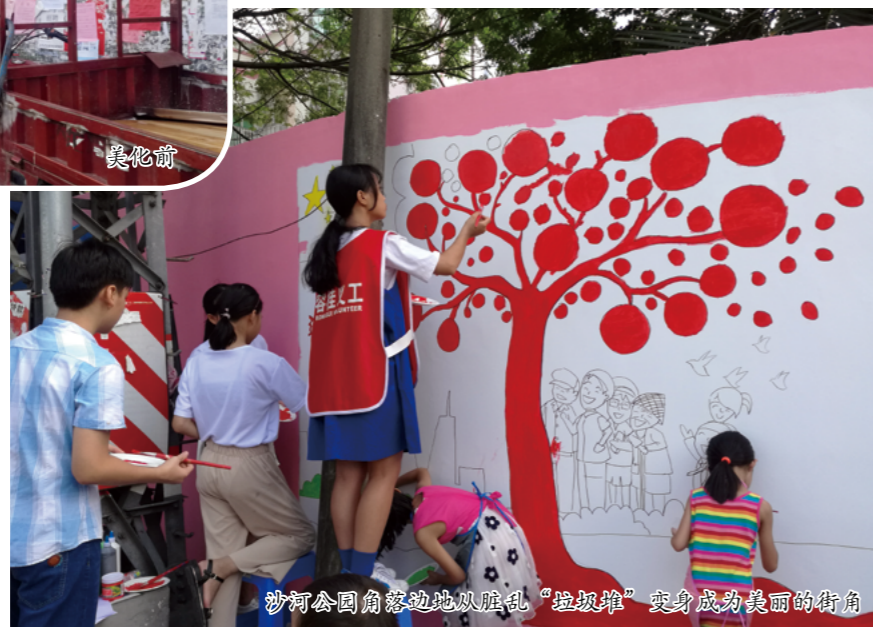
沙河公园角落边地从脏乱“垃圾堆”变身成为美丽的街角