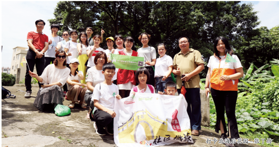
打卡北海后花园-张丫坊