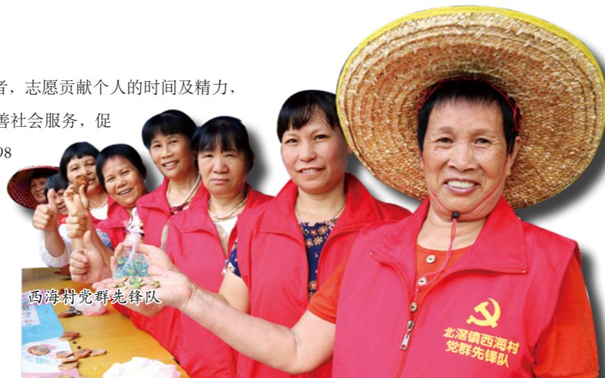
西海村党群先锋队

志愿者，一个熟悉的名字！志愿者，志愿贡献个人的时间及精力，在不为任何物质报酬的情况下，为改善社会服务，促进社会进步而提供服务的人。藉建党98周年到来之际，北滘西海、龙江左滩村联合社区党群先锋队、社区志愿者以及商户团体共同开展便民志愿