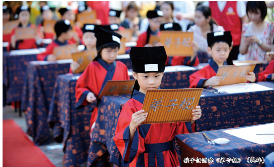
孩子们诵读《弟子规》（鹤峰）

台，“诗书继世长鹤峰书院活化计划”、“寻根鹤峰情——鹤峰自组织发展计划”、“上村龙舟青年培训”、“上峰体育青年篮球培训”等特色项目将相继铺开。随后，南方医科大学公共卫生学院下属党支部与鹤峰社区党委进行了结对共建，计划联合开展“党旗领航 创新引领 健康同行”系列活动，包括公共卫生政策宣讲、健康科普和检测等方面的服务，向社区居民普及健康知识，同时依托德风书院创客工坊，组织创客学院志愿者，面向社区中小學生开展创新教育。最后，在鹤峰书院组织社区亲子家庭开展人生四大礼之一——开笔礼，带领孩子们明智立志、感恩致敬。孩子们在家长的牵引下击鼓明志，带着豪情立下志向，一句句豪言壮志，一个个认真模样，感动着在场的每一个大人，引得大人们纷纷鼓掌。