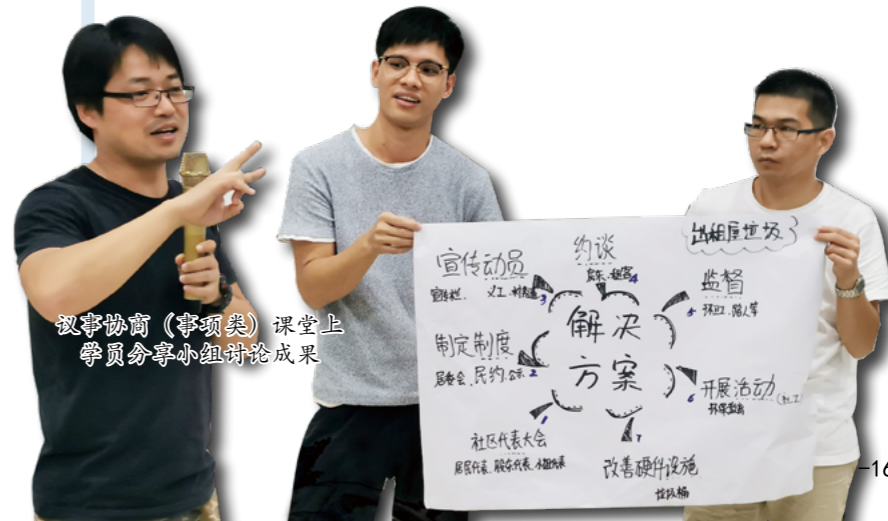
议事协商（事项类）课堂上 学员分享小组讨论成果

围绕社区治理创新，本计划分为党建引领下的社区营造、组织培育、议事协商（空间类）、议事协商（事项类）、社区社会服务5大模块课程，每个模块有融合交叉之处但各有重点；同时，按照培养对象需求分基础课程、进阶课程和高阶课程3种层次，每个模块根据具体课程内容有所差异，循序渐进地开展培养。