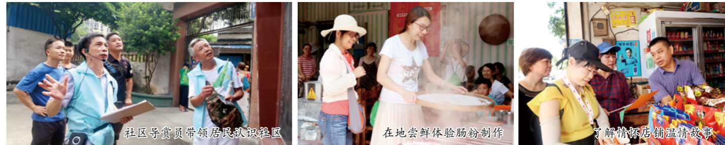
社区导赏员带领居民认识社区

（容桂街道上佳市社区居民委员会、鹏星社会工作服务社、均安镇鹤峰社区居民委员会、均安镇社会服务创新中心、陈村镇仙涌村民委员会供稿）