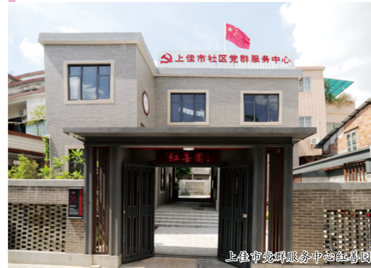
上佳市党群服务中心红善园

原来，为更好地加强宣传思想文化和精神文明建设工作，建设基层文化服务阵地，容桂街道上佳市社