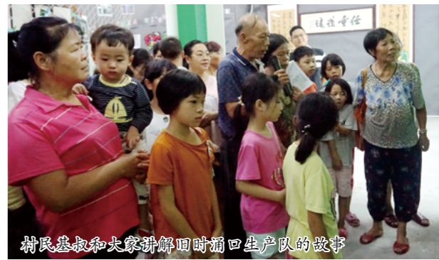
村民基叔和大家讲解旧时涌口生产队的故事